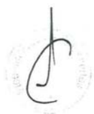
VERÓNICA ZAVALA LOMBARDI Ministra de Transportes y Comunicaciones