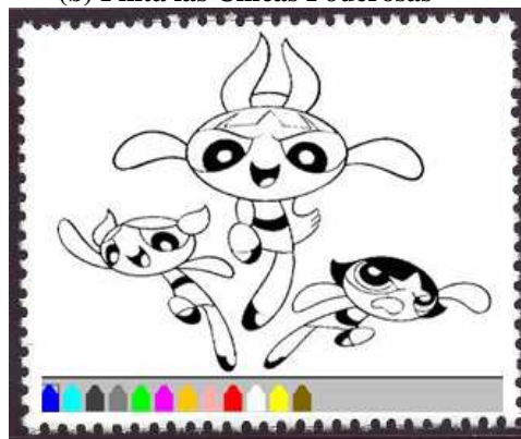
Las Chicas poderosas