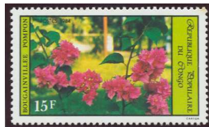
Republica Popular del Congo Nombre: Bougainvillee Valor Facial 15f