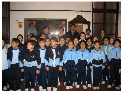
Colegio Champagnat Distrito: San Isidro