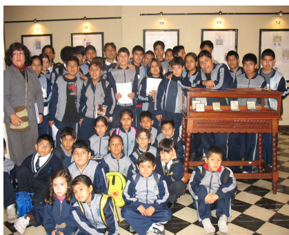
Colegio Ciro Alegría Distrito: San Martín de Porres