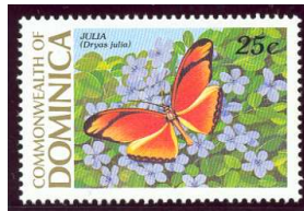
Republica Dominicana Nombre: Dryas julia Valor Facial 25c