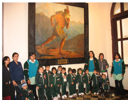
Colegio San Mateo Apóstol Distrito: San Martín de Porres