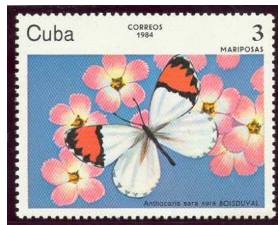
Republica de Cuba Nombre: Anthocaris Sara Sara Boisduval Valor Facial 3