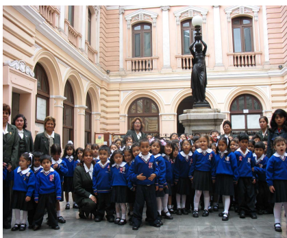
Colegio Santa Margarita Alto Real Felipe - Callao