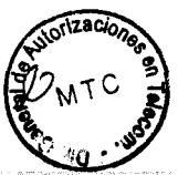
----- JORGE LUIS CUBA HIDALGO Viceministro de Comunicaciones Ministerio de Transportes y Comunicaciones